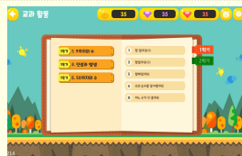
【교과활동】 교과서 차시별 학습