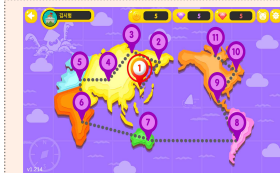
【탐험활동】 학생 주도적 학습