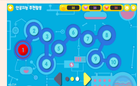
【AI 추천활동】 AI 지정 콘텐츠 학습