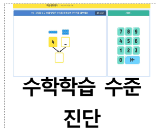
수학학습 수준 진단